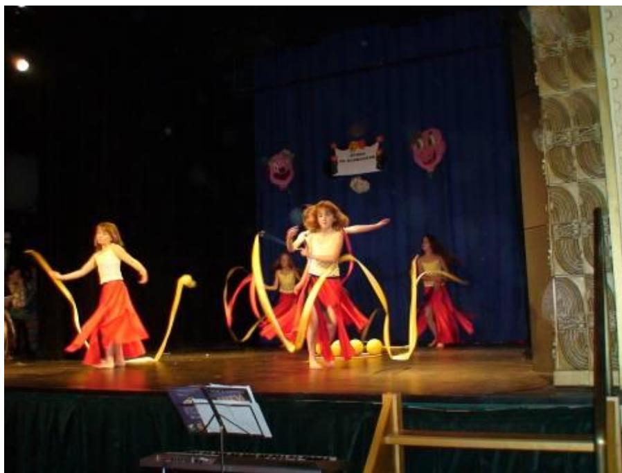
Závěrečný kabaretní pořad žáků literárně-dramatického a tanečního oboru