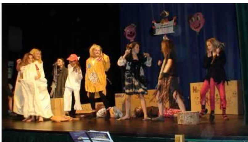
Závěrečný kabaretní pořad žáků literárně-dramatického a tanečního oboru