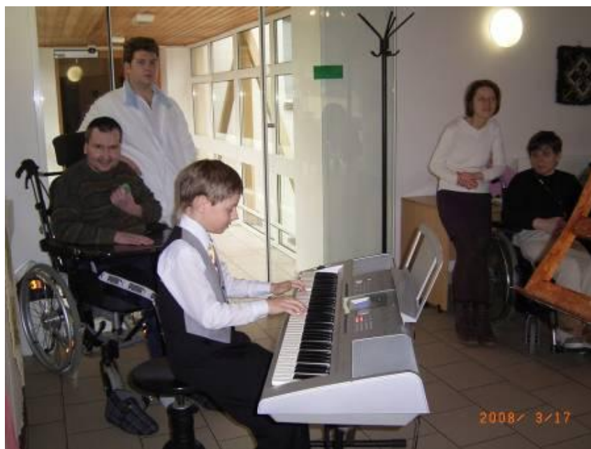
Vystoupení v ÚSPTP v Hořicích

Škola spolupracuje s ostatními soukromými ZUŠ v republice.