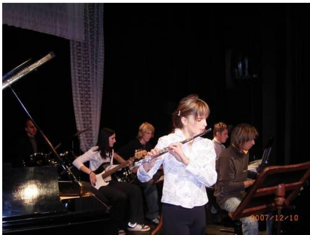
Z vánočního koncertu v Hořicích souborová hra