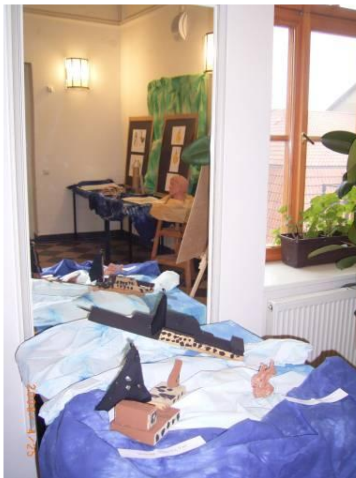
Výstava prací žáků výtvarného oboru v přísálí Městského úřadu v Hořicích