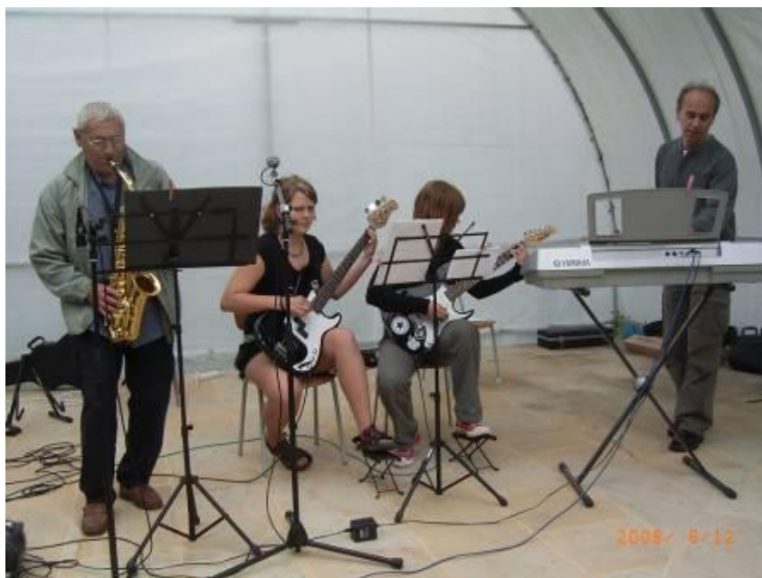
Z 6. mezinárodní výstavy „Kámen Hořice 2008“

Škola zřizuje všechny umělecké obory, které svým zaměřením obohacují spektrum nabídky volnočasových aktivit pro děti a mládež z Hořic a blízkého i vzdálenějšího okolí. Výsledky práce se promítají v úspěších žáků na soutěžích a přehlídkách a také v tom, že o školu je zájem a má stále dostatek žáků.