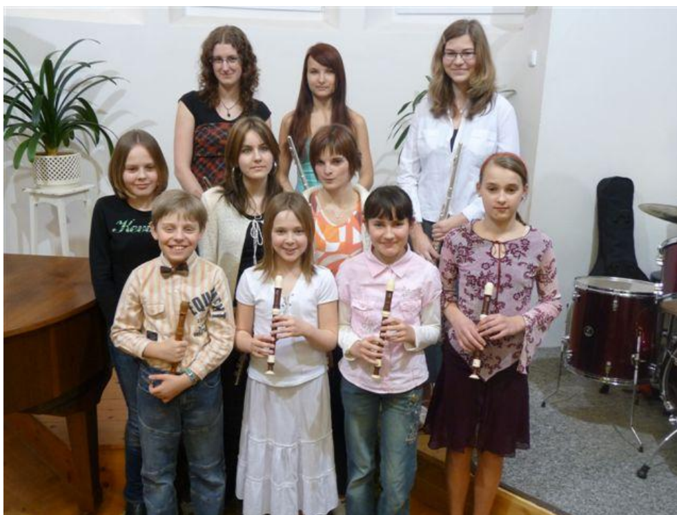
Školní kolo Národní soutěže ZUŠ ve hře na dřevěné dechové nástroje v Nové Pace

Krajské kolo soutěže MŠMT ve hře na dřevěné dechové nástroje 18. 3. 2009 pedagogický doprovod