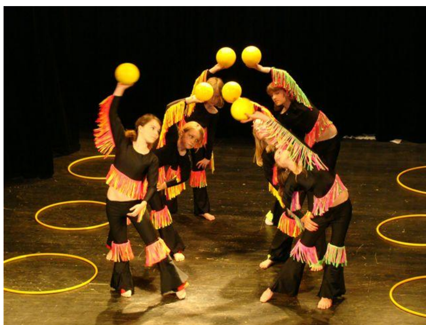
Závěrečné vystoupení tanečního oboru