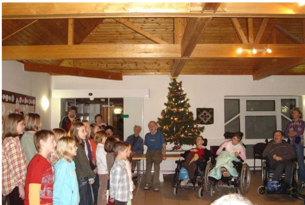
Vánoční vystoupení v ÚSPTP v Hořicích

Škola spolupracuje se ZUŠ v Semilech – hostování žáků na vystoupeních a koncertech se ZŠ na Pecce – výchovné koncerty se ZŠ a MŠ v Nechanicích – výchovné koncerty, divadelní představení s Kulturním domem v Nechanicích s Mateřským centrem v Nechanicích se ZŠ Miletín s Městským informačním centrem v Hořicích s Ústavem sociální péče pro tělesně postižené v Hořicích se ZŠ a MŠ v Hořicích a okolí při průzkumech a nábořech nových žáků