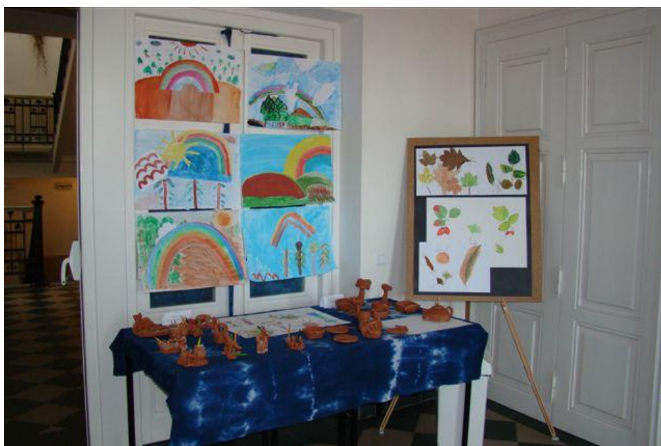
Výstava prací žáků výtvarného oboru v přísálí Městského úřadu v Hořicích

Výstava prací žáků probíhá průběžně po celý rok v přízemí budovy školy v Hořicích.