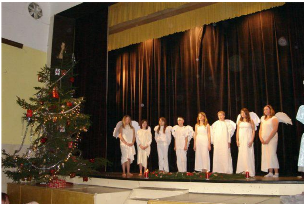
Vánoční vystoupení literárně-dramatického oboru v Nechanicích