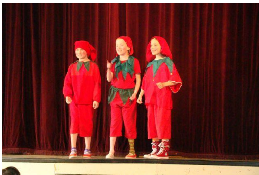
Divadelní představení Kašpárci zachraňují pohádky

Ve školním roce 2008/2009 pracovalo ve škole 14 učitelů, 1 administrativní pracovnice a 1 uklízečka.