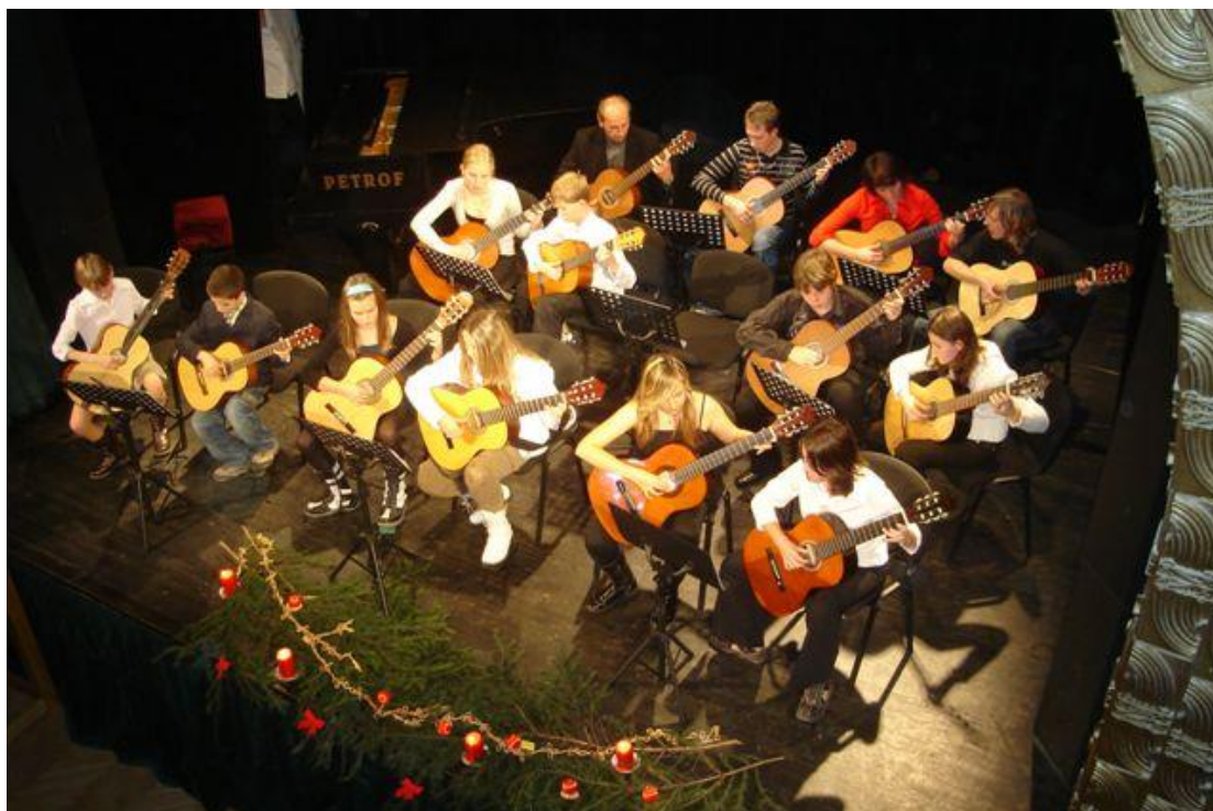
Z vánočního koncertu v Hořicích kytarový soubor

V souladu s § 5 odst. 3 c) zákona č. 306/1999 Sb., o poskytování dotací soukromým školám, předškolním zařízením a školským zařízením, ve znění pozdějších předpisů, ČR ČŠI hodnotí činnost školy (školského zařízení) ve sledovaných oblastech jako „vynikající.“